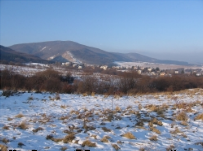
Делта Влячеца, Боровица, Кутало, Мале Бучино, Параклис, Делта Орявие

Вторник, 20 Май 2008г. 03:00ч. - Последна промяна Събота, 21 Ноември 2009г. 00:22ч.