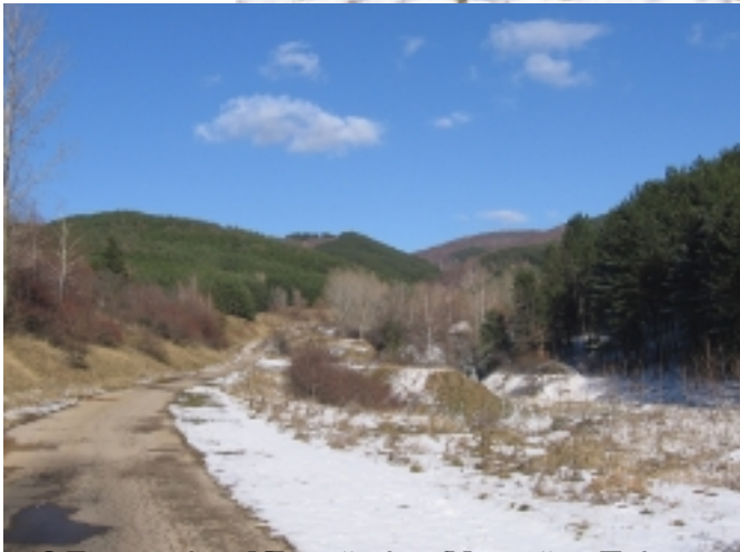
05 Брзход (Б. Манастир) в долината на река Камък, в Райдова градина