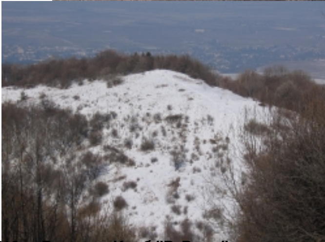
Битовица, Кутало, Боровица, Мале Бучино, Делта Орявие, Делта Влячеца, Боровица, Кутало, Мале Бучино, Параклис, Делта Орявие