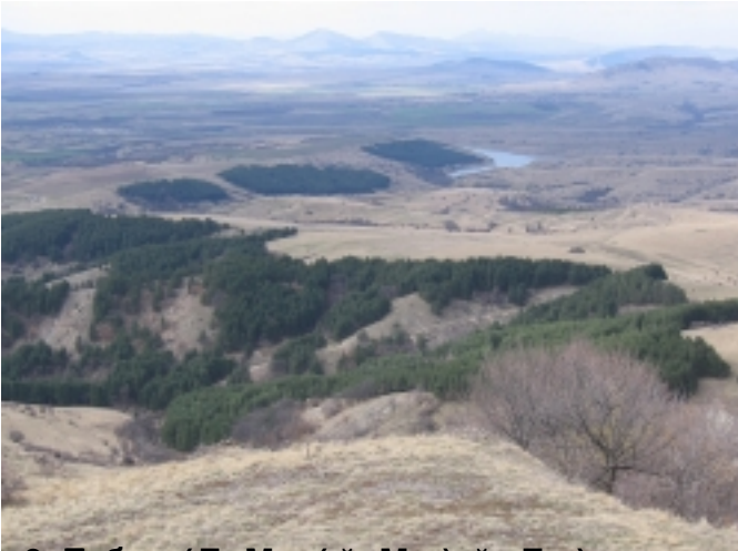
06 Езеро (Б. Манастир) в долината на река Камък, в Райдова градина

Вторник, 20 Май 2008г. 03:00ч. - Последна промяна Събота, 21 Ноември 2009г. 00:22ч.