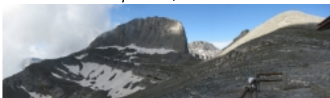
връх Стефани - известен още като Тронът на Зевс

Траклога обхваща върховете Скала, Митикас, Сколио и Стефани