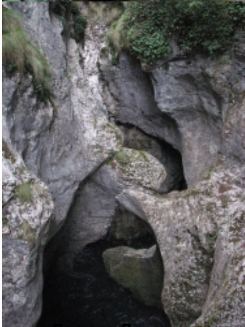
Пещера Дяволското Гърло: