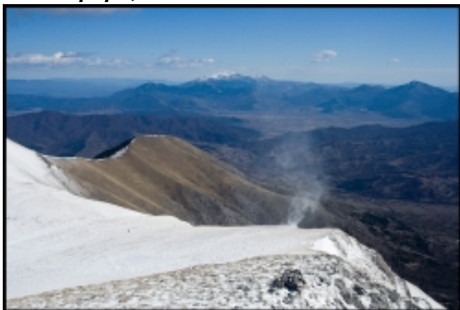
Малко снежно торнадо по билото

От Гоцев връх следва придвижване по билото към гранична пирамида 100, от