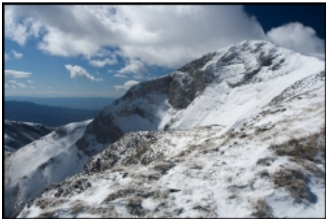
Козя стена при Гоцев връх

След понижението на главното било при Бельов дол следва сравнително полегато и продължително изкачване до следващите гранични пирамиди 101 и 102. Последната е сложена на Цари връх. При нея има възпоменателна табелка на гръцки, както и маркировъчна връхна пирамида на гръцка страна. Следващата гранична пирамида, 103, е последната по маршрута. Оттам граничната бразда продължава на изток, докато нашия път към заобления Алиботуш (Цари връх) води на север. Следва кратко изкачване, вече сме на Алиботуш.