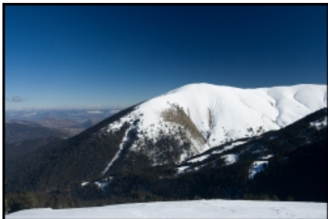
в. Цари връх

към стръмните склонове на Цари връх(Алиботуш), първенецът Гоцев връх и Шабран.