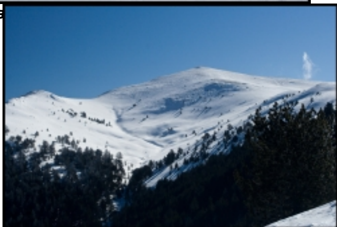
в. Гоцев връх