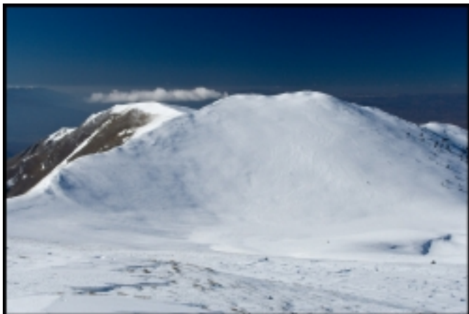
Шабран, гледка от Гоцев връх

Thursday, 27 March 2008 02:00 - Last Updated Saturday, 17 April 2010 17:18