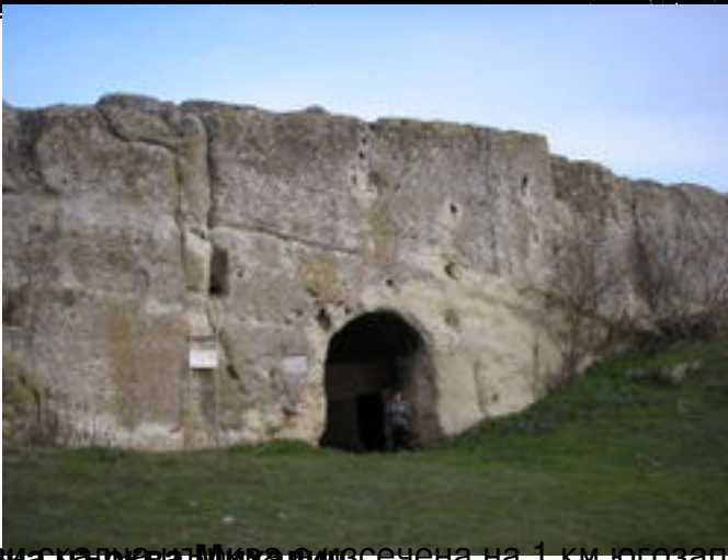
Скала скалните църкви е изсечена на 1 км югозападно от село Маточина в скалиста тераса. Датир