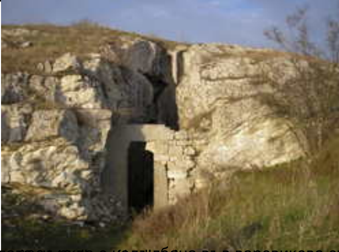
Църквата е изсечена в варовикова скална тераса. Уникалността на църквата е в това